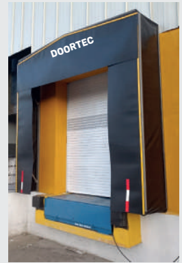
Abrigo con pendiente vierte aguas del 10%.

Su finalidad es proporcionar aislamiento en el momento de la carga y descarga de modo que se consiga un importante ahorro de energía así como la consiguiente protección de mercancías . El abrigo de muelle retractil se ha diseñado especialmente para proporcionar flexibilidad